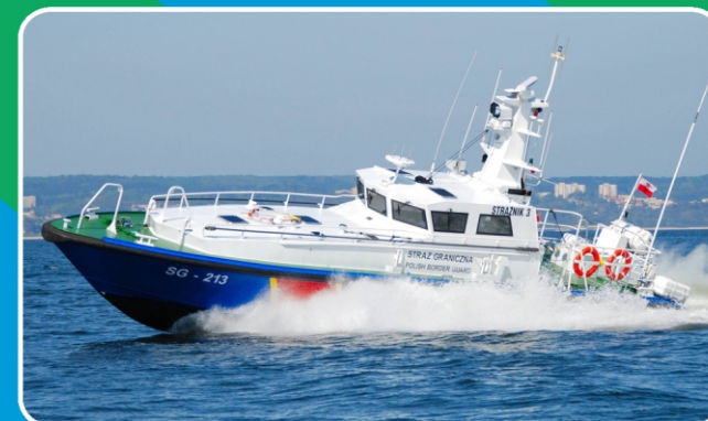
Jednostka interwencyjno-pościgowa projektu IC 16M III.