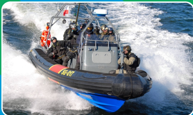
Łódź bojowa WZD MOSG klasy RIB projektu S-8900.