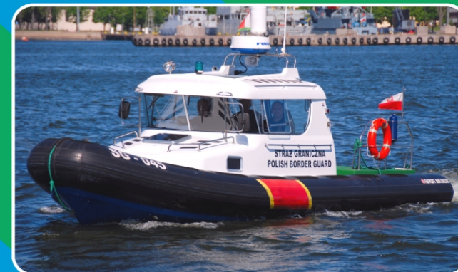
Szybka łódź patrolowa projektu Parker 900 Baltic C.