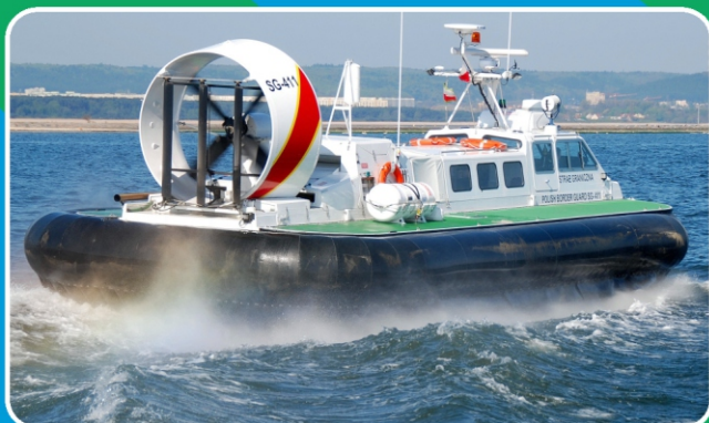
Poduszkiwiec SG-411 typu GRIFFON 2000 TD MK III