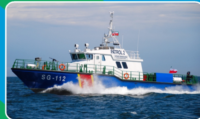
Jednostka patrolowa projektu Patrol 240 Baltic.