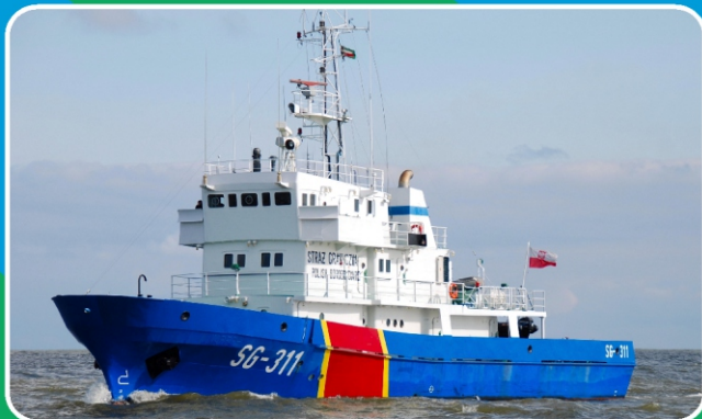
Pełnomorska jednostka patrolowa projektu SKS-40.